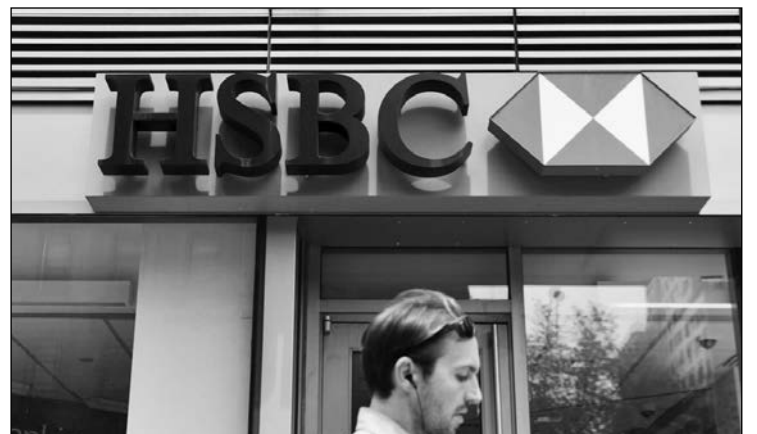
Sucursal del HSBC.

trabajadores de Londres tras el Brexit y dijo que trasladará al personal responsable de generar en torno a una quinta parte de sus ingresos por operaciones en Reino Unido a París. Grandes firmas financieras advirtieron durante meses antes del referéndum británico sobre la UE en junio que trasladarían puestos de trabajo fuera del país si se votaba a favor de la salida, pero no han dado detalles sobre cuántos o dónde irán.