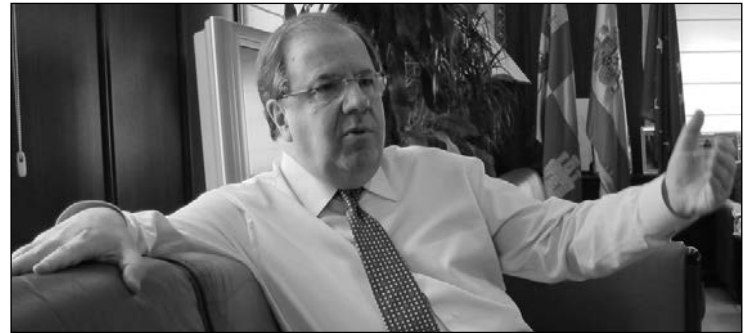
El presidente de Castilla y León, Juan Vicente Herrera.

Afortunadamente, el hecho de que FG haya sido el único, entre los muchos que aparecen en mi libro, que haya recurrido al viejo resorte de atemorizar a los medios, alienta mis esperanzas sobre los cambios que se están produciendo en el gobierno de las empresas en línea con lo que se lleva en los países más avanzados.