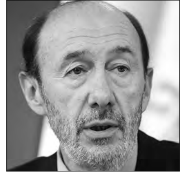
A. Pérez Rubalcaba.

madriñero Pedro Sánchez, al menos para la andaluza Susana Díaz. A pesar de que ha conseguido la mayoría de los avales para competir en esta carrera, su anclaje orgánico en el Partido Socialista es muy menguado. Y su debilidad sería suplida con el respaldo que le prestaría la federación andaluza, siempre atenta a la posibilidad de que la presidenta de la Junta pueda dar el salto a la política nacional con las redes de protección necesaria que no ha podido conseguir ahora. Susana Díaz se ha convertido, por necesidad, en el principal referente del PSOE para el núcleo duro del mundo económico. Sabe cómo hacer política y ha tomado, en parte, como modelo a José Bono , dueño y señor durante muchos años de Castilla y La Mancha, al que Zapatero frenó en sus aspiraciones a habitar La Moncloa.