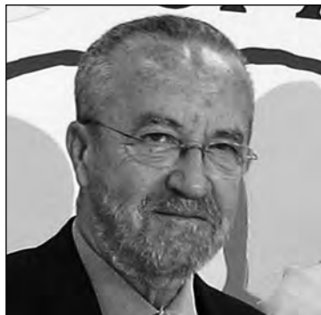
P. Arriola. EUROPA PRESS

El presidente del Gobierno, aseguran los parlamentarios del PP más veteranos y, por tanto, con mayor bagaje político, tendrá que pensar si remodela a fondo o no el Gabinete para transitar hasta las elecciones autonómicas y municipales de mayo de forma firme y con otro discurso al que ha venido entonando en la primera parte de la legislatura. Un análisis apresurado y un tanto ramplón conduciría a pensar, aseguran en las filas del PP, que un mal resultado electoral obligaría a Rajoy a cambiar el Consejo de Ministros para tomar oxígeno. Sería, en todo caso, una remodelación forzada por los acontecimientos y, por tanto, muy a contracorriente de los modos y costumbres que el presidente ha