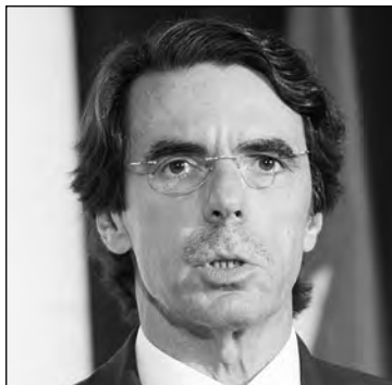
J. Mª. Aznar. F.M.

venido luciendo desde finales de 2011. Por el contrario, una reflexión más inteligente conduciría a pensar, se asegura en los aledaños de La Moncloa, que el jefe del Ejecutivo dispondría de mucha mayor capacidad de maniobra para cambiar el Gobierno a su antojo en caso de