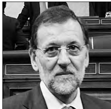
M. Rajoy.

una victoria electoral amplia sobre los socialistas. Hasta ahora, Mariano Rajoy no ha tenido quien le tosa, al margen de las periódicas incursiones de José María Aznar y su tropa en algunas escaramuzas que no han favorecido, precisamente, al expresidente en su faceta mercantil. Si el PP se viera legitimado de nuevo en las urnas, cualquier cambio que introdujera el principal inquilino de La Moncloa en su Gabinete sería inmediatamente bendecido en su organización, pues habría demostrado que sabe sobrevivir a las tormentas. La que ha conducido él personalmente durante la segunda recesión, no ha sido menor.