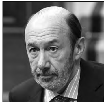
A. Pérez Rubalcaba.

distintos. Con Andalucía como principal y casi único bastión electoral, el equipo de Rubalcaba temía que si el domingo sufría un nuevo varapalo pudiera saltar por los aires el calendario de las primarias y con él toda la estructura montada desde el congreso celebrado en Sevilla