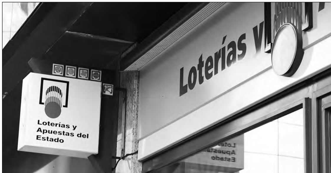
La Selae prevé ganar 1.989 millones de euros en 2013, un 10% más de lo que espera para este año.

2.200 millones que, por cierto, es lo que la ONCE viene a vender al año, es mucho. ¿Qué van a hacer para conseguirlo?