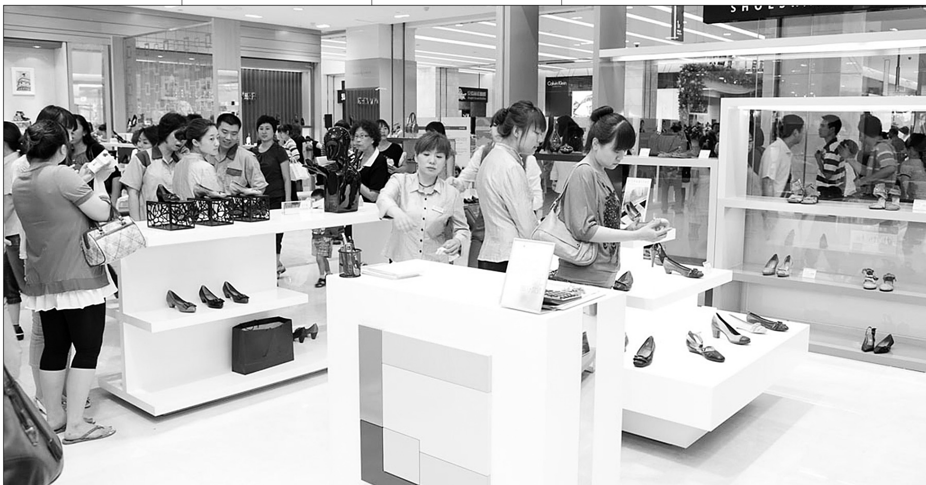
Tres cuartas partes del cambio radical en la reducción de la pobreza se deben a China, donde los ciudadanos tienen mayor acceso al consumo.