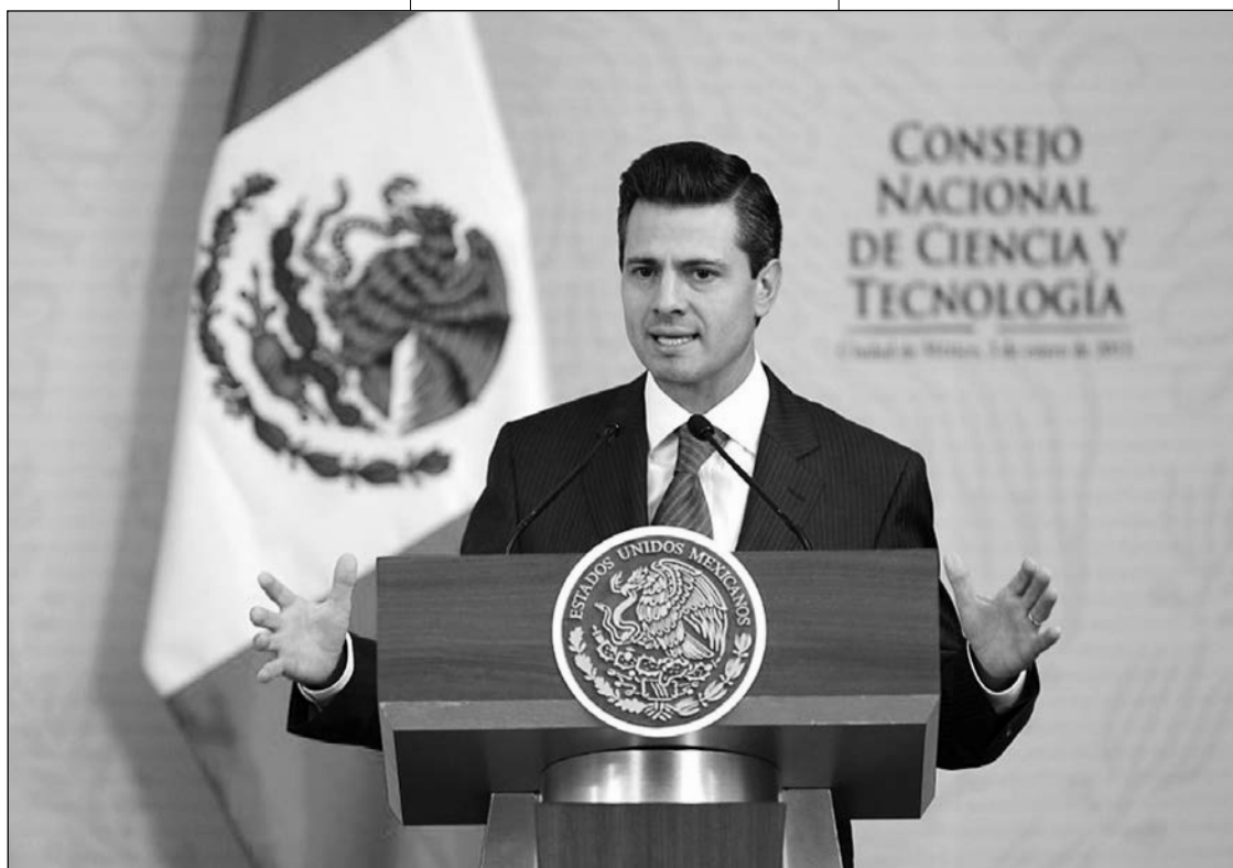
El presidente de México emprenderá la reforma fiscal y la energética y ya ha aprobado un instrumento de apoyo a las pymes.