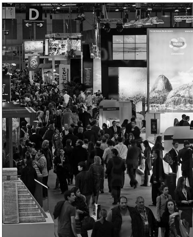
La feria celebra dos foros específicos para facilitar el encuentro entre expositores y compradores.