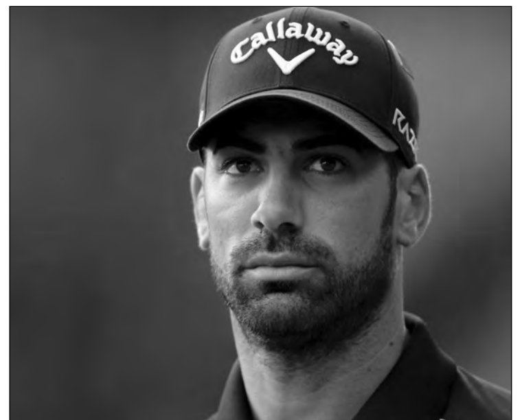
Ni Jiménez ni Quiros pudieron luchar por la victoria en la Copa del Mundo de Golf. Hace 27 años que España no ganaba y 11 que no lo hacía el equipo americano.

La pareja española concluyó la segunda ronda, disputada bajo la modalidad fourball, sin ningún error, arrancando un birdie en el hoyo 12 y un sensacional eagle en el 16 que les aupó hasta la cuarta posición.